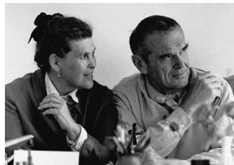
Charles & Ray Eames

Seit der Lounge Chair vor über 50 Jahren in Produktion ging, hat die durchschnittliche Körpergrösse je nach Region um bis zu 10 cm zugenommen. Um auch grösseren Menschen das Sitzerlebnis aussergewöhnlichen Komforts zu ermöglichen, hat Vitra in enger Abstimmung mit dem Eames Office die Dimensionen des Lounge Chair angepasst. Die Sitz- und Rückenschalen wurden dabei in ihren Proportionen so sorgfältig vergrössert, dass der Eames Lounge Chair in seinem optischen Gesamteindruck kaum verändert wurde.